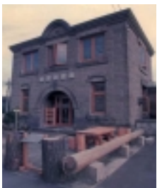
光ハイツ・ヴェラス石山の近くにある「ぼすとかん」(旧石山郵便局)は1940年に建てられた札幌軟石の代表的建物のひとつです。

石山通りは、夏は支笏湖・洞爺湖方面への行楽客に、冬は定山溪二セコ方面へのスキー客に利用される交通の大動脈ですが、「フルーツ・ロード」でもあります。札幌石山から定山溪への沿線両側には多くの観光果樹園が広がり、秋にはリンゴ狩り、ブドウ狩りなどたくさんの方が楽しめる便利さと自然が共存しているのも石山の特徴なのです。