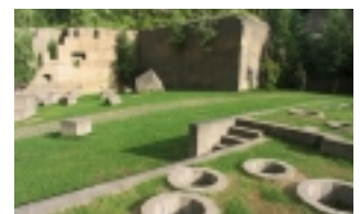
石山緑地